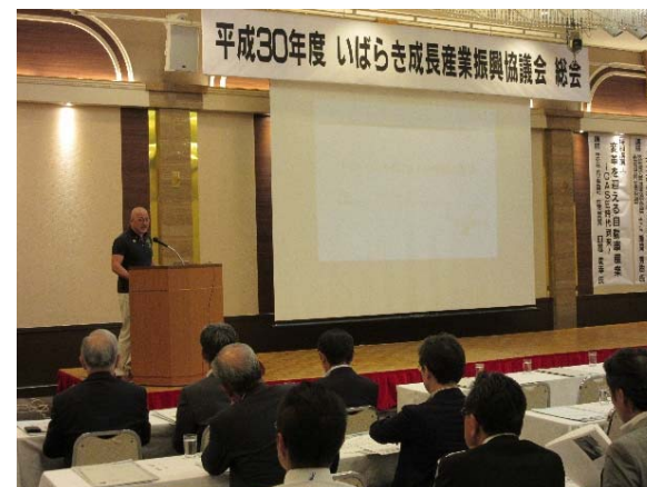
次世代技術研究会