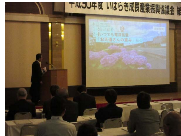
環境・新エネルギー研究会