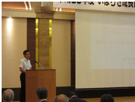
次世代自動車研究会