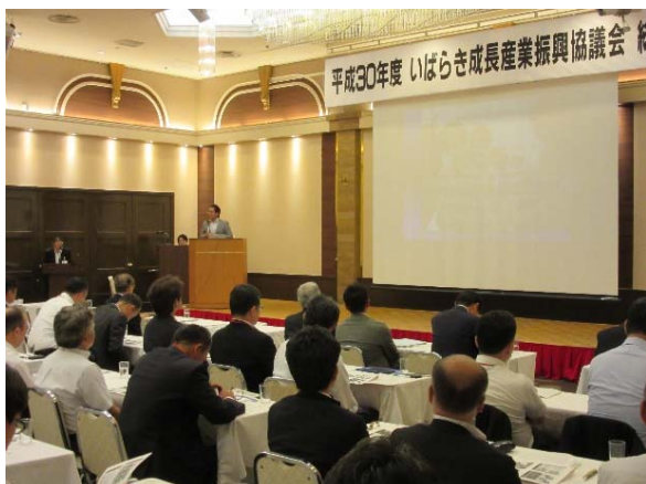
健康・医療機器研究会