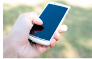
Web系から組込系まで各種開発に対応しております。