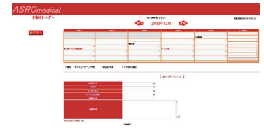
手術スケジュール管理・オーダーシステム「オペマネ」

整形外科に特化しており、整形外科関係のニーズを熟知しております。現在、当社で機器の製作はいたしません、ドクターとメーカーや工場の間でそれぞれの要望の橋渡しを行っております。