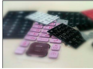
軽帯電話・ボタン類(製造販売)

優位技術など 1. 家電機器、自動車部品、電子機器、産業機器等の幅広い商品群を自社製造拠点・組立工場の活用や多数のサプライヤー協力体制によるオリジナル製品の企画・設計開発を手掛けております。 2. 国内外グローバルネットワークにおいて「部品調達＝あらゆる素材から完成品迄」「スピード＝営業・技術・品質管理スタッフでの迅速なレスポンス体制」「コンサルティング＝ネットワークでの最新情報提供及び材料・コスト削減・製造方法・品質改善・仕様提案」「品質管理＝製造工程・出荷検査まで一貫して実施」をストロングポイントとして部品をお届けする活動展開をしております。