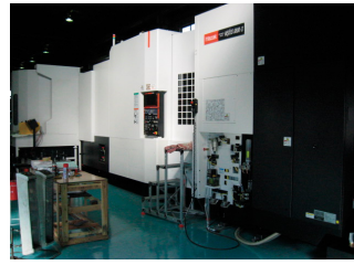
高精度同時多軸加工マシニングセンタでは、多面加工による工程集約、同時多軸制御による3次元曲面加工が可能です。大物・重量のお品の加工でも、剛性が高い両端支持のタイプのテーブルを採用しております。

社員一人ひとりが職人として、真心を持って社会に貢献できる会社であり続けたいと考えています。