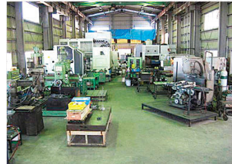
長年に亘り技術の向上、そして高品質を支えてくれた工場設備には、深い感謝の心と愛着を持ちながら日々丁寧に使用しております。