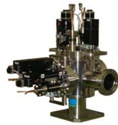
水冷4象限スリット

設計から始まり、様々な工程を経て、ご要望に沿える製品をご提供するべく妥協のない「物づくり」を心がけています。