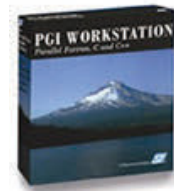
プログラミング開発環境