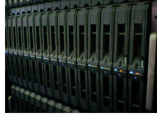
クラスタシステム