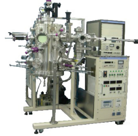
超高真空多層膜成長装置 (MBE)

当社は、研究開発に携わるユーザーのために、目的に合ったONLY ONEの装置を提案し、設計、製作、販売をいたしております。