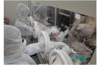
がんワクチンの研究開発状況

セルメディシン株式会社は、“がん免疫療法のパイオニア”として、がんワクチンの研究開発を行っています。また、「自家がんワクチン」による自由診療への技術協力事業も全国展開しています。