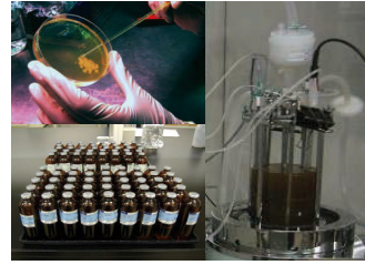
微生物の各種培養試験