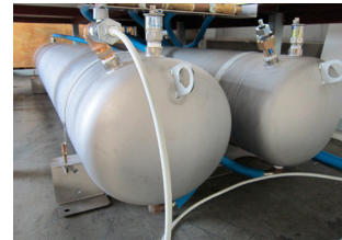
非常時給水タンク「みずがめ君」