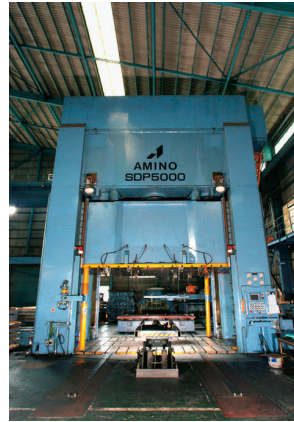
油圧5000t深絞りプレス