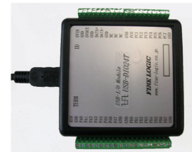
USB/LAN/232C 接続可能なデジタル 入出力モジュール