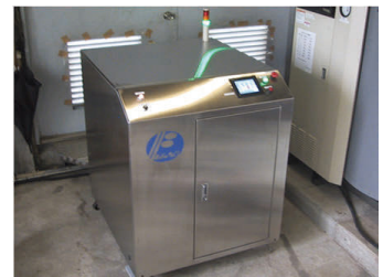
エマルジョン燃料製造装置