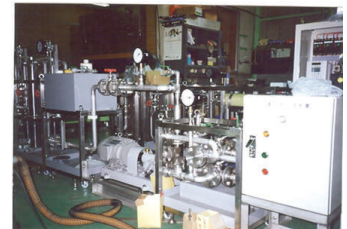
放射性廃液処理装置