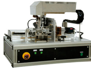
産業用インクジェット液滴特性測定装置