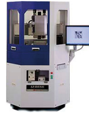
オンデマンドインクジェット塗布装置