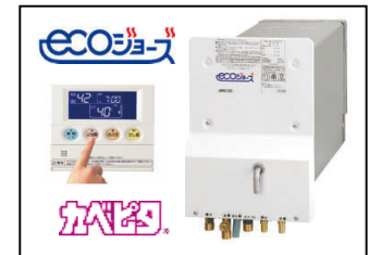
壁貫通設置型ガスふろ給湯器