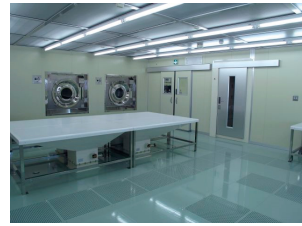
CICクリーンスーツ専用プラント