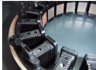
自動車関係製品(インサート成形品)