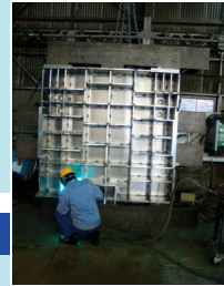
アルミニウム溶接:溶接後機械加工を行います。