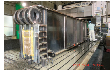
大型5面加工門型マシニングセンターによる加工