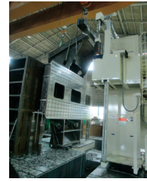
大型中ぐり盤による加工:工作機械のベッドの加工