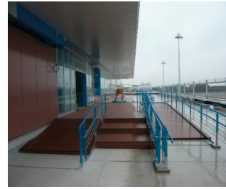
「プラスッド」施工例 茨城空港ターミナルビル