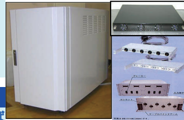
板金加工：サーバーラック組立 ・電源ユニット