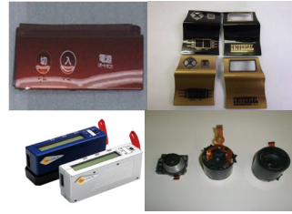
樹脂加工：成形・印刷・塗装・組立