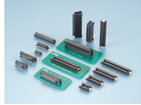
0.5mmピッチフローティングコネクタ (DYシリーズ)

当社は、工業機器をはじめ電子応用機器などの領域で、長年にわたってコネクタ関連製品を開発・製造してきました。そこで培った設計・製造ノウハウと豊富な実績が、私たちの最大の財産です。小型で高機能な先端のエレクトロニクス機器には、コネクタの高度な接続信頼性と高密度が求められています。エレクトロニクス業界が求める先端のコネクタをいち早くご提供するために、R&Dに経営資産を投じ、高機能化と小型化を追求しています。大きな可動量を確保した狭ピッチフローティングコネクタや、高機能ながら細径部分を通すのに最適な極細同軸ケーブル用コネクタ、産業用機器ではスタンダードなハーフピッチコネクタ、次世代産業機器用であるクォーターピッチコネクタなど、小型・高信頼・高機能を追求し、お客様にとっての付加価値を高めた当社製品は、さまざまなエレクトロニクスメーカーから高い評価をいただいております。