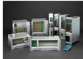
ケルラックシステム