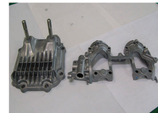
ダイカスト鋳造品