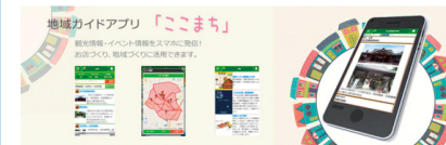
地域ガイドアプリ「ここまち」