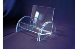
什器(気泡の少ない接着)