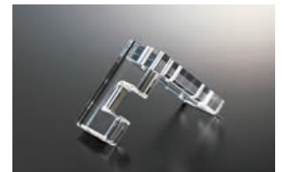
医療器(アクリル切削加工・接着・磨き)