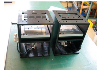
マシニングセンター量産用加工治具