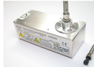
キセノンフラッシュランプモジュール