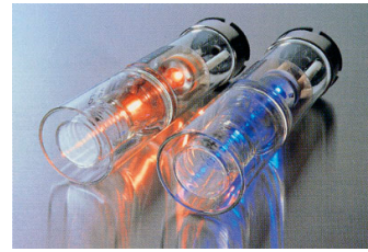
ホローカソードランプ