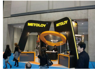
東京モーターショー