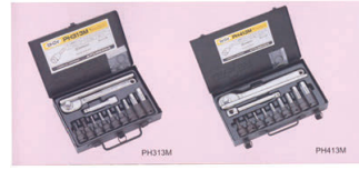
ヘックスソケットセット

＜標準工具の製造＞ 六角棒レンチ、ソケットレンチ、スパナ等の締付け工具類を設計、製作 ＜特殊工具の製造＞ 市販されていない特殊形状の締付け工具類の製作 ＜排水処理施設の設計、施工、維持管理＞ 生活排水、工場廃水の処理施設の設計、施工、維持管理