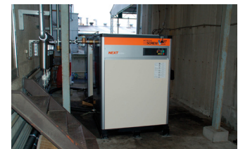
コンプレッサー設置工事