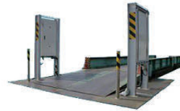
トラックゲートモニター (MDK-TGM3002)