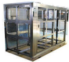
貴重品保管ゲージ(受注生産品)