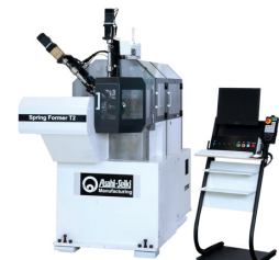
金型不要、最新CNC曲げ加工機(12軸)