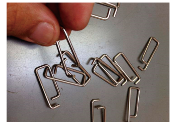
カバナー用ばね金具