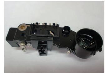
ターミナル、プッシュ4個のインサート成形品—ブラシホルダーターミナル