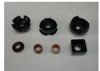
各種ブッシュ、セツエンカン