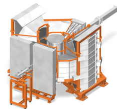
特殊環境中性子回折装置