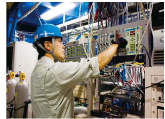
加速器・ビームラインの運転・保守・メンテナンス

●ニュークリアエンジニアリング デコミッショニングに向けた調査・検討 放射線測定・サーベイ