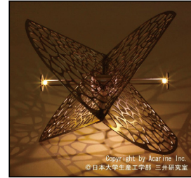
産学官 共同開発品