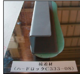
ハードロック接着