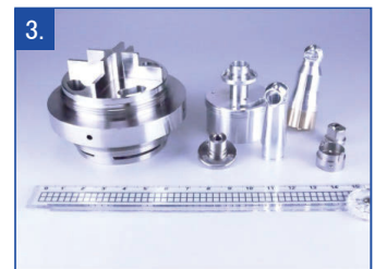
3. 複合旋盤による同時加工