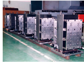
横型マシニングセンター用イケール