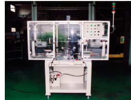
プッシュ穴あけ加工機