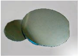
シリコンウエハー

事業概要 シリコン、サファイア、ゲルマニウム、SiC、GaN等 半導体・MEMS用 単結晶ウエハーの加工・販売