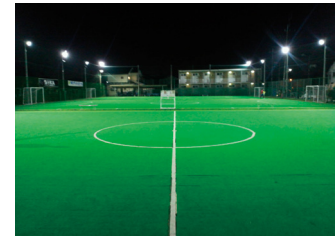
LED照明スポーツ施設導入事例