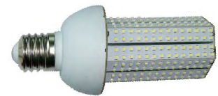
360° 発光 水銀灯代替 LED