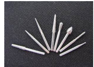
歯科用ダイヤモンドバー