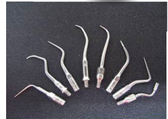
歯科用超音波スケーラチップ