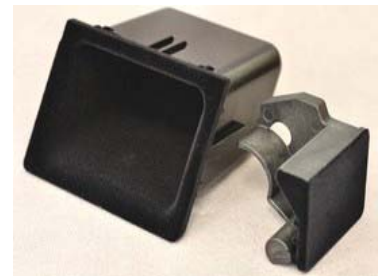
静電植毛製品J: 自動車内装パーツ