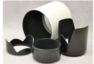
静電植毛製品: カメラのレンズフード