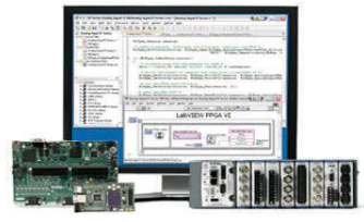
軟性・拡張性の高い計測器制御アプリケーションを提案・開発します。