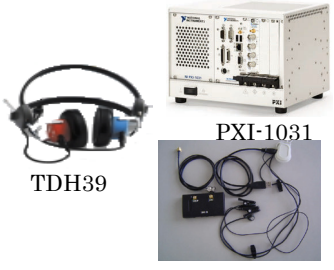
聴性定常反応(ASSR)を用いた聴覚検査装置の開発