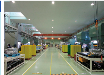
茨城本社生産工場

当社は、お客様の声を真摯に受け止め、コスト低減・技術革新の推進に向けて日々活動しております。