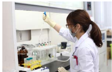
迅速・安価で高精度な検査