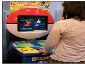
各種ゲーム用センサー