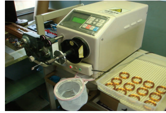
自動巻線機(細線巻用)

昭和27年創業来、約半世紀にわたり信頼の出来る製品を提供しております。特に主力製品であるマグネットコイルは、エレベーター、エスカレータのブレーキとして、電力関係では遮断器の投入、保持、引き外しとして、産業機器関係ではモーターのステーターとしてそれぞれの重要な部門に使用される製品であります。「コイルは人間でたとえれば『心臓』であり、最後まで動いていなければならない」の精神の基、社員が一丸となり常に品質管理を徹底し、安心、安全のものづくりにチャレンジしています。