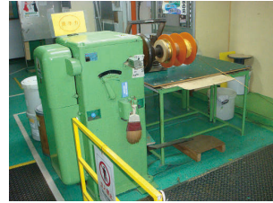
単軸巻線機(太線用)